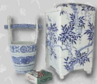
陶磁器 (油壺・花器・重箱)